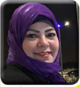
كُتبت - د. هويدا الشريف