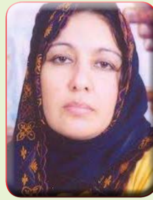
بقلم / سهام عزالدين جبريل

راشد سنة (١٩٤٢م) الحزب النسائى الوطنى، والذي كان على رأس مطالبه قبول النساء في كافة وظائف الدولة، كما شكلت درية شفيق حزب " بنت النيل" سنة (١٩٤٩م) والذي دعمته السفارة الإنجليزية،