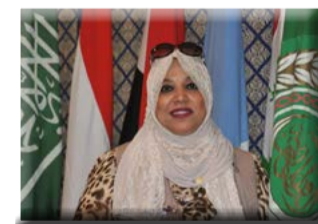
كُتبت - هناء السيد

وخطت خطوات كبيرة للكشف عنه وعلاجه، مشيرة إلى أن إقبال المواطنين على التحاليل جعل المرضى يتعافون سريعاً، مؤكدة أن مصر تواصل جهودها لتكون خالية من الفيروس. وأكدت أهمية توحيد التشريعات الصحية بما يكفل نظاماً صحياً يوفر تغطية شاملة للمواطنين. وأشكرت الدكتورة هالة زايد عن شكر وتقدير مصر للدول العربية لمساندتهم لها وتعازيهم لمصر في مصابها الأليم ممثلاً في حادث حريق محطة مصر أمس الأربعاء والذي خلف عشرات الضحايا والمصابين.