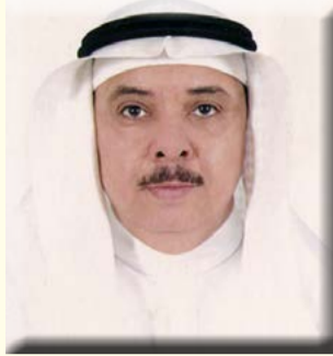
بقلم/ الأستاذ الدكتور محمد بن عبد الرجيم شاهين

البغم من الشعب الهوائية والتي تسبب ضيق هذه الشعب مما ينتج عنه الصعوبة في التنفس وحدوث أزمات الربو. والبصل الطازج هو الأفضل لتنظيف الشعب الهوائية المسدودة وتحسين التنفس.