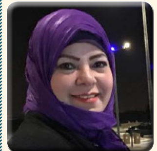
كتبت - د. هويدا الشريف

مؤكدًا على إهتمام الدولة بكافة مؤسساتها بتقديم الرعاية الفائقة لهم. وكلف المحافظ رئيس مركز ومدينة بئر العبد بدراسة احتياجات هذه الأسر، ومطالبها للعرض عليه لاتخاذ اللازم لتلبيتها. رافق المحافظ مدير الشؤون الصحية بشمال سيناء ورئيس مركز ومدينة بئر العبد .