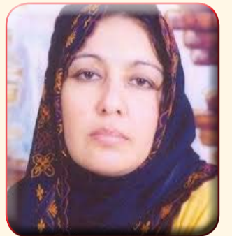
بقلم / سبام عز الدين جبريل

الميعاد ومملكة داود ووعود الرب كما اشار في كلماته واين انتم من سيناء ورد القائد المصري البليغ بان مصر في سيناء سيناء وسيناء هي درع مصر منذ فجر التاريخ منذ اشراقات الحضارة الانسانية وقبل التوراه وبنى اسرائيل وماتم تحريفه. بصراحة هذا المشهد ذكرني بمشهد احد قادة الموساد الاسرائيلي وكان اسمه ابو فرج كان يحاول تاكيد هذه الفكرة التوراتية والاكذوبة اليهودية واتذكر حوار شبيهه معه عندما كنا طلبة نساغر عن طريق الصليب الاحمر وكيف كان ردنا عليه ان مصر حاضرة في سيناء منذ اطلالة الحضارة الفرعونية وعهودها الاولى