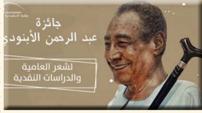
جائزة عبد الرحمن الأبنودي لشعر العامية والدراسات النقدية

أعلنت مكتبة الإسكندرية للعام الثاني على التوالي عن جائزة عبد الرحمن الأبنودي لشعر العامية والدراسات النقدية، وهذا لما للشاعر المصري الكبير من إسهام في مختلف جوانب الإبداع من شعر، ونقد، وجمع للتراث، وحوار درامي مميز، وأغانٍ تغنى بها أشهر مطربي الوطن العربي.