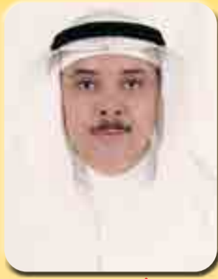
بقلم/ الأستاذ الدكتور محمد بن عبد الرحيم شاهين

من بين فوائد تناول ثمار الموز للجسم هو أنه يسبب ما يحتويه من نسب وفيرة من الفيتامينات والمعادن يعد مصدر للطاقة الطبيعية، حيث وجد أنه يحتوي على الألياف، وفيتامين ب٦، والبوتاسيوم، والمغنيسيوم، والتي تعد من العناصر الغذائية المهمة للجسم، كما وجد أن تناول الموز بعد ممارسة الرياضة يعطي الجسم الكثير من الطاقة. وقد ذكرت بعض التقارير أن ثمار الموز يمكن أن تكون الخيار