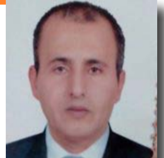
إعداد | سعيد شفيق