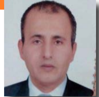
إعداد | سعيد شفيق