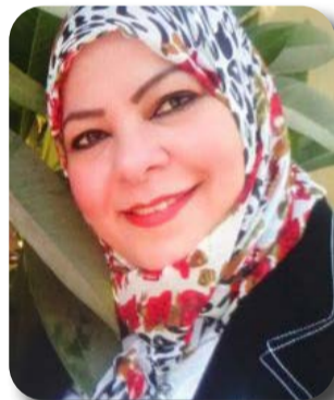
العريش- د.هويدا الشريف

لانتصارات أكتوبر المجيدة، قام اللواء دكتور خالد مجاور محمد محافظ شمال سيناء بوضع اكليل الزهور علي قبر الجندي المجهول بساحة الشهداء في مدينة العريش، وقرأة الفاتحة علي أرواح الشهداء، وسط عزف الموسيقى العسكرية لسلام الشهيد. وأكد المحافظ علي اننا انتصرنا في حرب أكتوبر عسكرياً وسياسياً واستطعنا استرداد كامل أراضيها، مشيراً إلي أن حرب الإرهاب هي محك حقيقي لاختبار إرادة الشعب المصري، فمصر هي الدولة الوحيدة التي تغلبت علي الإرهاب وتعافت