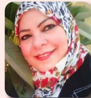
العريش - د. هويدا الشريف

وقال المحافظ، إن تعاون الحكومة مع مؤسسات المجتمع المدني والقطاع الخاص يؤكد تكاتف الجميع من أجل تنمية وتعمير سيناء، حيث اتحاد الحكومة مع المجتمع المدني والقطاع الخاص لتكوين مثلث متكامل، استطاع