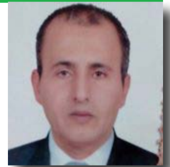
إعداد | سعيد شفيق أفقيًا