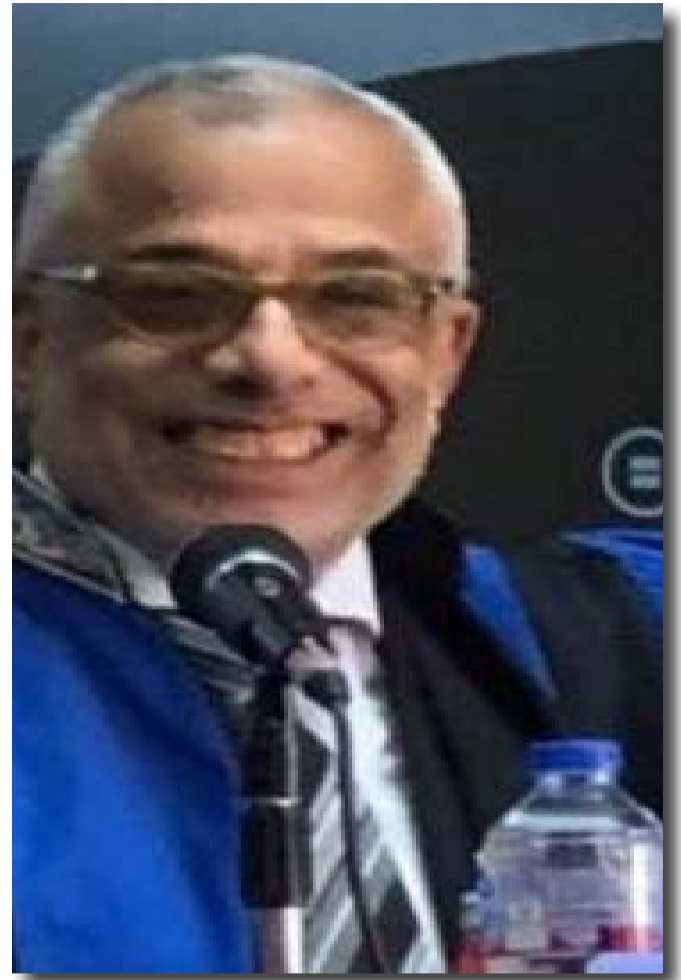
دكتور / السيد مرسى

يا جند الله إن رسول الله معنا في المعركة، طهروا تراب الوطن من رجس الغاصب وانصروا الله ينصركم والأمة كلها من ورائكم مؤمنة بالنصر " هذا هو نص المنشور كان له السحر والذي تم توزيعه على الجنود والضباط قبل عبور قناة السويس مباشرة وتحقيق ملحمة ٦ أكتوبر ١٩٧٣ والمعروفة عند المصريين بالعاشر من رمضان وعند الإسرائيليون بحرب يوم كيبور أو الغفران وهي الحرب الرابعة في سلسلة الحروب العربية الإسرائيلية أعوام ١٩٤٨ و١٩٥٦ و١٩٦٧ منذ زرعت كلا من إنجلترا وفرنسا هذا الكيان في أرض فلسطين ، هذه الحرب التي أعادت الثقة للشعبين المصري والعربي، من خلال الدور