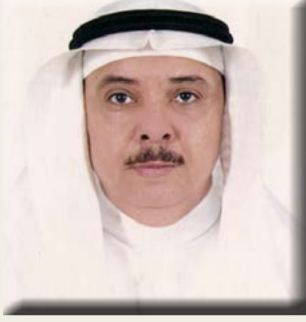
بقلم/ الأستاذ الدكتور محمد بن عبد الرحيم شاهين

يعدّ التمر الهندي واحداً من أهم أنواع العائلة البقولية، وأشجاره معمرة دائمة الخضرة، ويعتقد أن موطنه الأصلي إفريقيا الاستوائية، وينتشر زراعته في كل من السودان، والهند، ومصر، وجزر الكاريبي، والسنغال، والنيجر، ويمتاز بمذاقه الشهي جُذاً، وخصائصه الغذائية العالية القيمة؛ كونه يحتوي على نسبة عالية من الأملاح المعدنية، والفيتامينات، والبروتين، والدهنيات، والمواد السكرية، وحمض الليمون، وغيرها من المركبات المهمة للصحة، الذي جعل منه أحد الأغذية الرئيسية التي يعتمد عليها الإنسان. وفي هذا المقال سنتحدث عن فوائده الصحية والطبية والعلاجية،