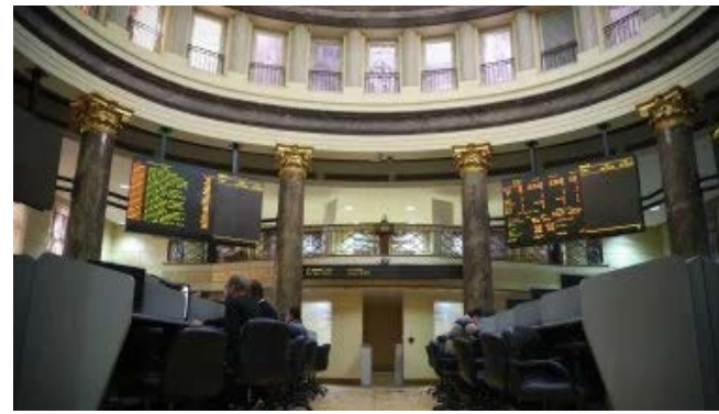
٢٨١٩٠ نقطة، وقفز مؤشر "إيجي إكس ٣٠ للعائد الكلي"

بنسبة 0.27% ليصل إلى مستوى ١٣٥٤٢ نقطة. كما ارتفع مؤشر الشركات المتوسطة والصغيرة "إيجي إكس ٧٠ متساوي الأوزان" بنسبة 0.73% ليصل إلى مستوى ٧٩٧٤ نقطة، وصعد مؤشر "إيجي إكس ١٠٠ متساوي الأوزان"، بنسبة 0.64% ليصل إلى مستوى ١١١٩٥ نقطة.