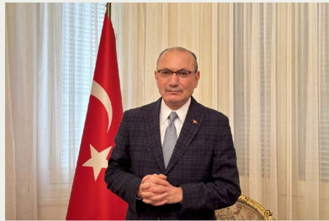
الرئيسان سيارتين منفصلتين من المطار، العلم المصري ثم يتوجها إلى قصر إحداهما تحمل العلم التركي والأخرى الرئاسة بعد استراحة قصيرة لشرب

وأشار خلال لقاء تلفزيوني لبرنامج «على مسؤوليتي» مع الإعلامي أحمد موسى عبر شاشة «صدي البلد»، مساء الإثنين، إلى أن «الرئيس أردوغان اهتم بالرئيس السيسي أكثر من غيره من الرؤساء»، وتجاوز البروتوكولات المعتادة.