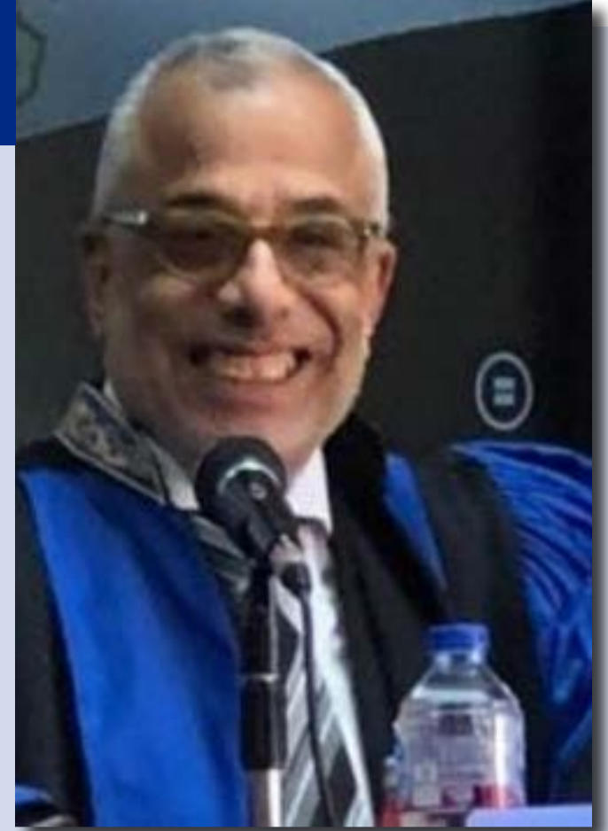
دكتور / السيد مرسي

تحسين التشريعات، باعتباره أحد الشركاء في تحقيق الاستقرار والتقدم، وسوف يتم عرض هذه القوانين والأحكام على النحو التالي:- أولاً: القوانين ١- على الصعيد المحلي: ١) قانون تقرير زيادة في علاوة غلاء المعيشة الاستثنائية: يخص الموظفين المخاطبين بقانون الخدمة المدنية والعاملين بالدولة غير المخاطبين به، وتقرير زيادة في المنحة الاستثنائية للعاملين بشركات القطاع العام وقطاع الأعمال العام، ومنح أصحاب المعاشات أو المستحقين عنهم منحة استثنائية. ٢) تعديلات قانون الضريبة على الدخل: وفيه رفعت الحكومة حد الإعفاء الضريبي من ٣٠ ألف جنيه إلى ٤٠ ألف جنيه سنوياً، مع تعديلات جديدة في الشرائح الضريبية لدعم الطبقات المتوسطة وتشجيع الاستثمار. ٣) تعديل قانون الإجراءات الجنائية: وفيه دخلت تغييرات شاملة على النظام القضائي، تشمل تشكيل دوائر جنائيات جديدة في محاكم الاستئناف لتسريع الفصل في القضايا الجنائية ٤) قوانين اقتصادية جديدة: وشملت تعديلات على قانون المحاكم الاقتصادية، حيث تم رفع النصاب القيمي للدعاوى بهدف تسريع إجراءات التقاضي وتخفيف العبء على المحاكم ٥) قانون تقرير بعض التيسيرات للمصريين المقيمين بالخارج. ٦) تعديل بعض أحكام القانون رقم ١٢١ لسنة ١٩٨٢ في شأن سجل المستوردين. ٧) قانون الوكالة المصرية لضمان الصادرات والاستثمار.