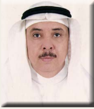
بقلم / الأستاذ الدكتور محمد بن عبد الرحيم شاهين

للبصل علاقة بالجهاز الهضمي، حيث وجد انه يساعد الجهاز الهضمي على تأدية وظائفه، كما يعمل على حل العديد من مشكلات الهضم، فيعمل البصل كملين طبيعي للمعدة مما يجعله مفيداً جداً في حالات الإمساك، كما يعد البصل من