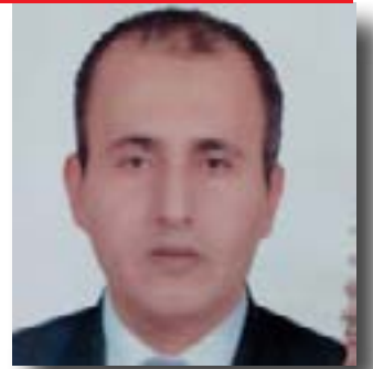
إعداد / سعيد شفيق