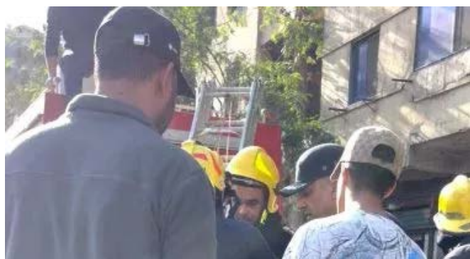
من الاهالي بالنيهار عقار في إمبابة وانتقل رجال المباحث والحماية إلى موقع الحادث وجارى حصر ونقل

استخرج رجال الحماية المدنية جثتين من أسفل ركام عقار إمبابة المنهار وتم نقلهم بواسطة سيارة اسعاف إلى المستشفى وتقوم الوداد بعمليات رفع الركام لتسهيل إجراء عمليات البحث عن أى اشخاص آخرين . انهيار عقار سكني مكون من ٤ طوابق وكان عقار سكني مكون من ٤ طوابق انهيار بمنطقة إمبابة وانتقل رجال الحماية المدنية إلى مكان البلاغ. نقل المصابين للمستشفيات القريبة و تلقت غرفة عمليات النجدة ،بلاغاً