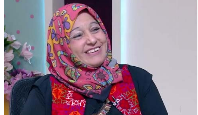
بقلم / سهام عز الدين جبريل

جانب تمكين المرأة والشباب باعتبارهما ركيزتين للاستقرار والتنمية. كما تبرز أهمية تطوير الخطاب الإعلامي الوطني، وتعزيز الثقة بين المواطن والدولة، لمواجهة محاولات التشكيك وبناء وعي جمعي قادر على الصمود. أما على المستوى المحلي في سيناء، فإن أجندة ٢٠٢٦ تمثل مرحلة ترسيخ لما تحقق من استقرار أمني، والانطلاق بقوة نحو التنمية المستدامة. فالتحدي الأساسي يتمثل في تحويل التنمية من مشروعات إلى أنماط حياة مستقرة، عبر توطيد الاقتصاد، وخلق فرص عمل حقيقية لأبناء سيناء، ودعم الصناعات البيئية والتراثية، والزراعة الحديثة، والسياحة المستدامة. كما يمثل الاستثمار في الإنسان السيناوي، خاصة في التعليم والثقافة وتمكين المرأة، أحد أهم مفاتيح استدامة الأمن والتنمية معاً. وفيما يخص المسار المتوقع لعام ٢٠٢٦، فمن المرجح أن يتسم بالواقعية والبراغماتية على مختلف المستويات، مع استمرار إدارة الأزمات بدلاً من تسويتها بشكل جذري، لكن مع وجود فرص حقيقية لتحقيق اختراقات تنموية وسياسية للدولة التي تمتلك رؤية واضحة، وقدرة على التكيف، وسرعة في اتخاذ القرار. خلاصة القول، إن أجندة ٢٠٢٦، رغم تعقيداتها، تفتح نافذة مهمة لإعادة ترتيب الأولويات عالمياً وإقليمياً، ومنح مصر، ومعها سيناء، فرصة لتثبيت نموذج تنموي وأمني أكثر توازناً، يقوم على الإنسان، ويحمي الهوية، ويحول التحديات إلى فرص حقيقية للمستقبل. د/ سهام عز الدين جبريل دكتواره في الإعلام السياسي والعلاقات الدولية - زمالة الأكاديمية العسكرية للدراسات الاستراتيجية العليا - عضو البرلمان المصري سابقاً.