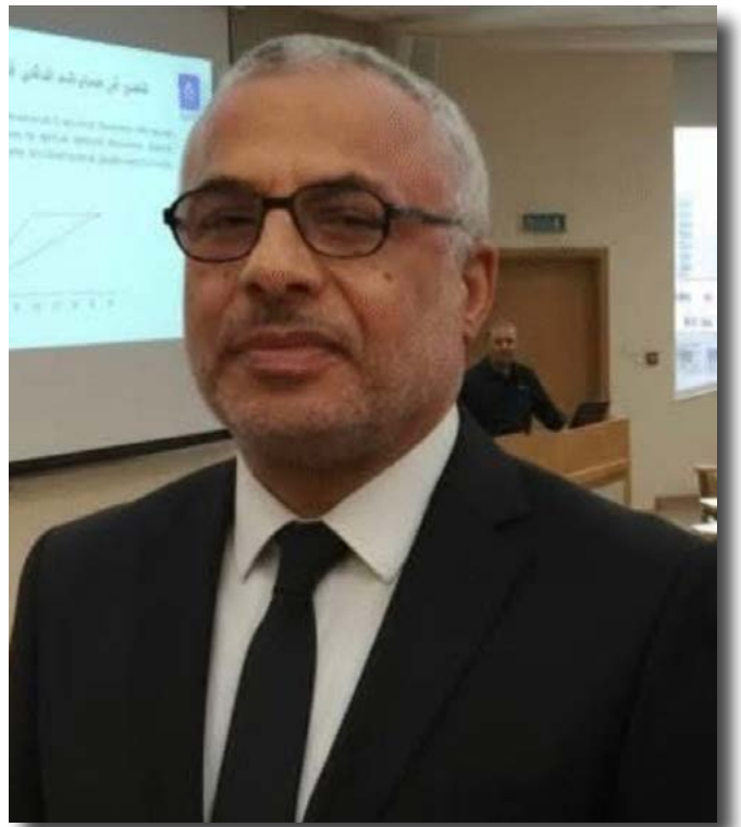
بقلم الدكتور : السيد مرسى الصعيدى

في زمنٍ تتزاحم فيه الضوضاء، ويعلو فيه الصخب على المعنى، يجيء برنامج ”دولة التلاوة“ كواحة من السكينة، وكشاهدٍ بليغ على أن مصر دولة قراء - ذكرت معها التلاوة، وإذا سُئل عن القرآن، أشار الناس إلى حناجرها قبل أن يسيروا إلى خرائطها. ليس ”دولة التلاوة“ برنامجًا عابرًا في جدول البث، ولا هو مسابقة تُقاس بالتصويت والأرقام، بل هو وثيقة حضارية، تُعيد الاعتبار لمدرسةٍ مصريّة عريقة، صاغت وجدان الأمة بقدر ما صاغت أسماعها، ورفعت التلاوة من حدود الصوت إلى آفاق الروح، حين لم يتعامل مع القارئ باعتباره صاحب