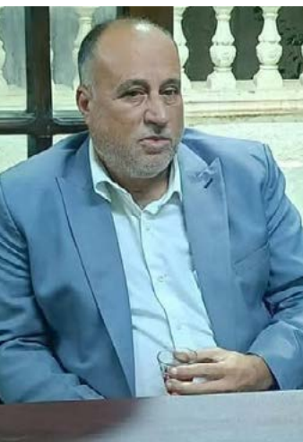
ومراكز المحافظة وكلها مشاريع ستخدم الإستثمار والتنمية، وتساهم في نمو الناتج الإقتصادي القومي لمصرنا الحبيبة.