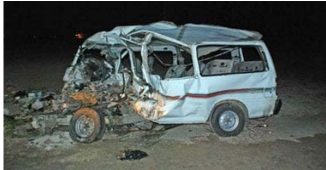
تصادم سيارة ميكروباس وإصابة ٧ أشخاص آخرين في حادثي سير منفصلين بمركزي بدر وكفر الدوار بمحافظة البحيرة.

لقي شخص مصرعه وأصيب ٧ آخرون في حادثي سير منفصلين بمركزي بدر وكفر الدوار بمحافظة البحيرة، فيما باشرت الأجهزة الأمنية التحقيقات للوقوف على ملابسات الواقعتين.