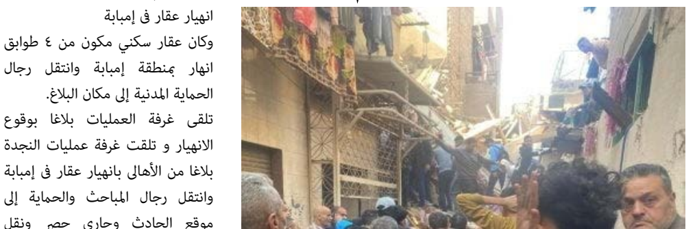
المنهار وسط قيام رجال المباحث بجمع المعلومات والبيانات اللازمة حول الواقعة. يستكمل رجال الحماية المدنية عمليات البحث عن ٦ أشخاص بينهم سيدات وأطفال من أسفل ركام عقار إمبابة