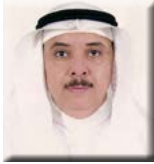
بقلم/ الأستاذ الدكتور محمد بن عبد الرحيم شاهين

الغم ويقضي على رائحته الكريهة، ويحارب البكتيريا المسؤولة عن تسوس الأسنان، ولهذا يستخدم في معاجين وغسول الفم، ويساعد على محاربة العدوى عن طريق الفم. كما أن النعناع يعالج العديد من اضطرابات الجهاز التنفسي، حيث تساعد أوراقه على تخفيف الاحتقان في الأنف والحنجرة والقصبات الهوائية والرئتين، وتسرع من عملية الشفاء خاصة في نزلات البرد والأنفلونزا. كما وجد أن له فوائد في علاج مرض السيل، وله كذلك خصائص علاجية تساعد على تخفيف أعراض الربو، حيث أن رائحته القوية جدا تساعد على فتح الممرات الهوائية وتعمل على إراحة النفس، ولهذا يدخل ضمن صناعة أجهزة الاستنشاق، كما أن تناول النعناع يساعد على تخفيف السعال، وطرد البلغم، وينشط القلب والدورة الدموية، وله خصائص مضادة للالتهابات. وقد وجد أن النعناع يساعد على تسكين الآلام وخاصة آلام المعدة والعضلات والصداع، كما أنه مهدئ للأعصاب، ويساعد على الاسترخاء، ويساعد على تخفيف آلام الدورة الشهرية. كما أن بعض الإنزيمات المتواجدة بالنعناع تساعد على الوقاية من السرطان وعلاجه وخاصة سرطان البروستاتا،