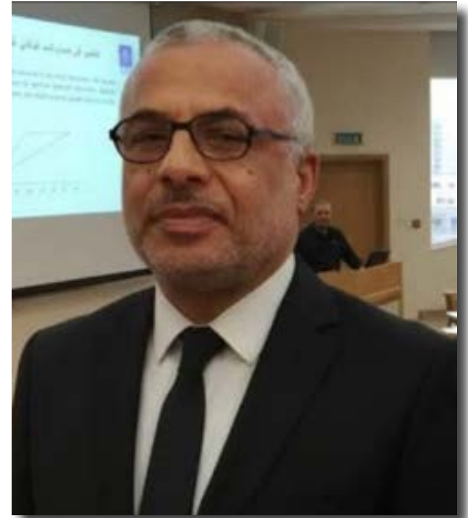
بقلم الدكتور : السيد مرسى الصعيدى

لم يكن التاريخ يوماً بريئاً، لكنه لم يكن فاجراً إلى هذا الحد، فما يجري اليوم تحت لافتة الأفروسنترية لا يمكن إدراجه في خانة البحث العلمي، ولا الجدل الأكاديمي المشروع، بل هو مشروع سياسي كامل الأركان، يستخدم التاريخ أداة، والهوية سلاحاً، والجغرافيا غاية نهائية ، وعندما ظهرت (الأفروسنترية) في سياق أمريكي محدد، كرد فعل مفهوم على قرون من التهميش العنصري للسود في الغرب. غير أن المشكلة لم تكن في السؤال، بل في الإجابة المُعدّة سلفاً، فبدلاً من استعادة دور أفريقيا في الحضارة الإنسانية على أساس علمي، جرى