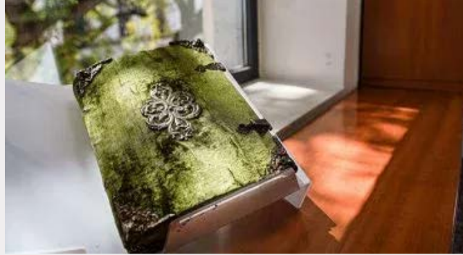
مصدر الوثيقة وأبلغ البائع المحققين أنه لا يعرف

مصدر الوثيقة، وقال إن والده اقتناها في سبعينيات القرن الماضي وأكد الأرشيف أن المخطوطة اختفت بين عامي ١٩٠٧ و١٩٠٩، ولم تُعَ رسماً قط. وضعت مراسيم نقابة المخمل (Gremi de Velluters) في ١٦ فبراير ١٤٩٧، وصُدِّقت رسمياً في ١٣ أكتوبر من العام نفسه من قِبَل فرديناند الكاثوليكي وتتضمن المخطوطة أيضاً قوانين أخوية سان جيرونيمو، التي تأسست عام ١٤٨٣. وصُنع الكتاب من رق أخضر، وغُلِّف بمخمل من اللون نفسه، وزُيِّن بزخارف