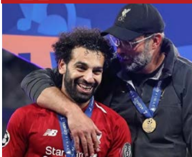
كلوب: محمد صلاح أسطورة لن تتكرر.. وإنجازاته تفوق التوقعات