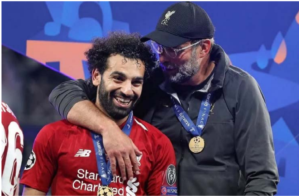
قدمه اليسرى مذهلة وسرعة كبيرة، ثم بدأ في تسجيل الأهداف

بشكل مستمر». كما كشف كلوب عن جانب من شخصية محمد صلاح، مشيرًا إلى أنه لم يكن راضيًا عن مستواه في فترات سابقة، حيث حرص على تطوير نفسه بشكل كبير، حتى أنه أنشأ مرمى في منزله للتدريب لساعات طويلة يوميًا وتحسين قدراته الهجومية. وفي سياق متصل، أكد كلوب صعوبة توقع عدد الأهداف التي يمكن أن يسجلها محمد صلاح خلال الموسم، قائلاً: «ربما نسأله يومًا عن الرقم الذي يطمح إليه، لكن إذا كان قريبًا مما يحققه الآن، فسيكون ذلك مذهلاً». من الصعب تخيل ذلك. باريس سان جيرمان ضد ليفربول يحل ليفربول الإنجليزي المحترف ضمن صفوفه النجم المصري محمد