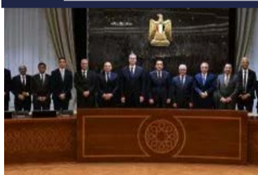
رئيس الوزراء يشهد توقيع شراكة بين إندوراما وفوسفات مصر لإنشاء مصنع جديد للأسمدة