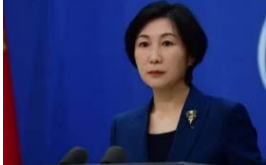
الصين ترحب بالاتفاق بين أمريكا وإيران وتؤكد مواصلة دورها لاستعادة السلام في المنطقة