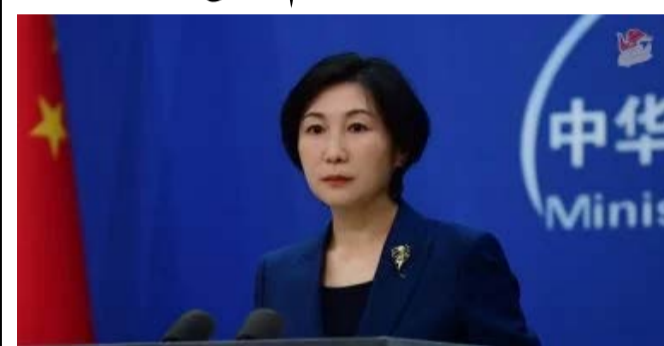
كبرى لديها حس المسؤولية، ستواصل الاضطلاع بدور بناء وتقديم إسهامات إيجابية في استعادة السلام والطمأنينة في منطقة الخليج والشرق الأوسط.

رحبت الصين بإعلان الأطراف المعنية التوصل إلى ترتيبات لوقف إطلاق النار بين أمريكا وإيران، مؤكدة أنها ستواصل الاضطلاع بدور بناء وتقديم إسهامات إيجابية في استعادة السلام والطمأنينة في منطقة الخليج والشرق الأوسط. ودعم الوساطة الدولية ووقف التصعيد وقالت المتحدث باسم وزارة الخارجية الصينية ماو نينج - اليوم الأربعاء، وفقا لما نقلته وكالة الأنباء الصينية (شينخوا) - إن الصين ترحب بإعلان الأطراف المعنية التوصل إلى ترتيبات لوقف إطلاق النار في الصراع