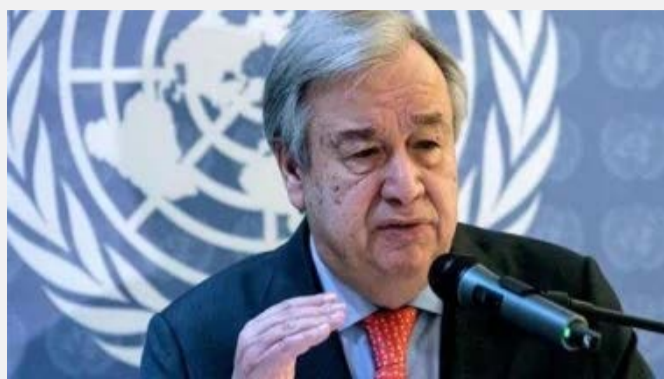
وأعرب جوتيريش عن تقديره العميق للمعانة الإنسانية. لتقدير جهود الوساطة الدولية لجهود باكستان والدول الأخرى المنخرطة

في تيسير التوصل إلى وقف إطلاق النار، وأشار إلى أن المبعوث الشخصي له جان