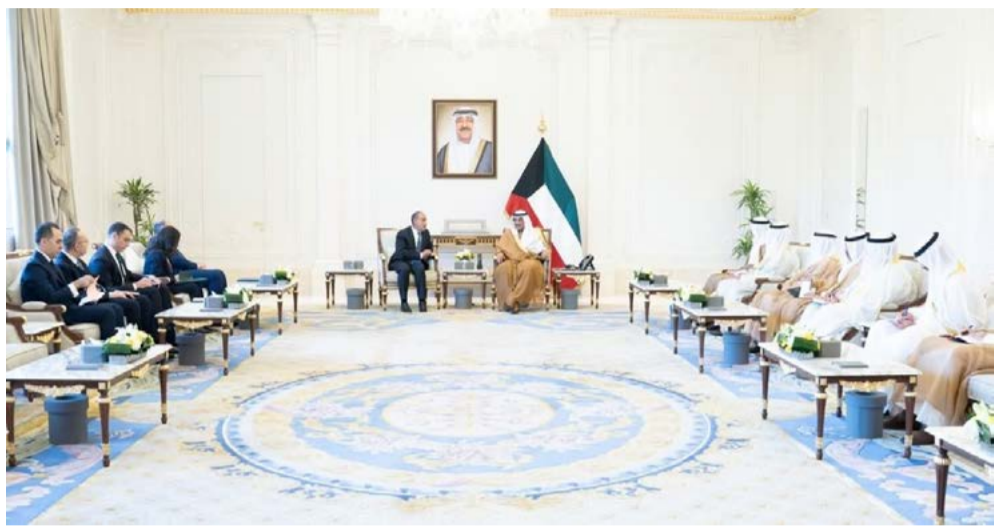
عبد العاطي بتسليم رئيس الجمهورية إلى الشقيقة، رسالة خطية من أمير دولة الكويت