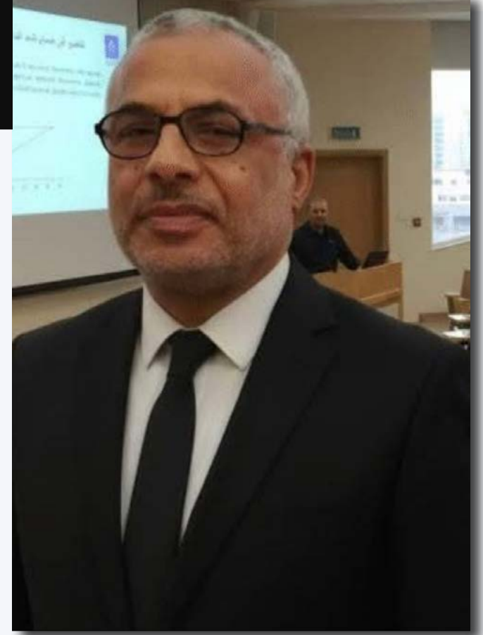
بقلم: دكتور السيد مرسى الصعيدي

كان لا بد - ونحن نخوض في مستنقع الحرب التي تُطبخ الآن على نار هادئة بين إسرائيل وأمريكا من جهة، وإيران من الجهة الأخرى - لصناعة شرق أوسط جديد، واستكمالاً لحديثنا السابق عن اليهود في التلمود، سنخرج في الحديث حول أكبر بلطجي في التاريخ السياسي أسمه: العم سام، والعم سام، لمن لا يعرفه، ليس رجلاً من لحم ودم، بل هو فكرة تقول: "أنا أفهم مصلحتك أكثر منك وسأخذها منك إن لم تفهم، والفكرة هنا أخطر من المدفع، فعندما دخل العم سام فيتنام قديمًا، لا ليزرع الأرز مع الفلاحين، بل ليحرب أحدث ما عنده من ألعاب نارية وإرهاب الروس، خرج بعدها تاركًا خلفه أرضًا محروقة وشعبًا يقول: "شكرًا... لا