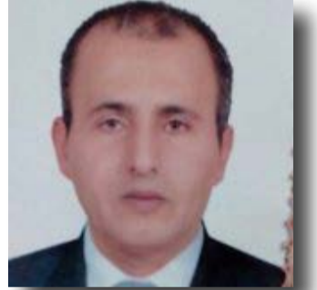
إعداد | سعيد شفيق