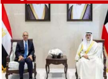
وزير الخارجية يعقد مباحثات مع نظيره الكويتي ويؤكد تضامن مصر الكامل